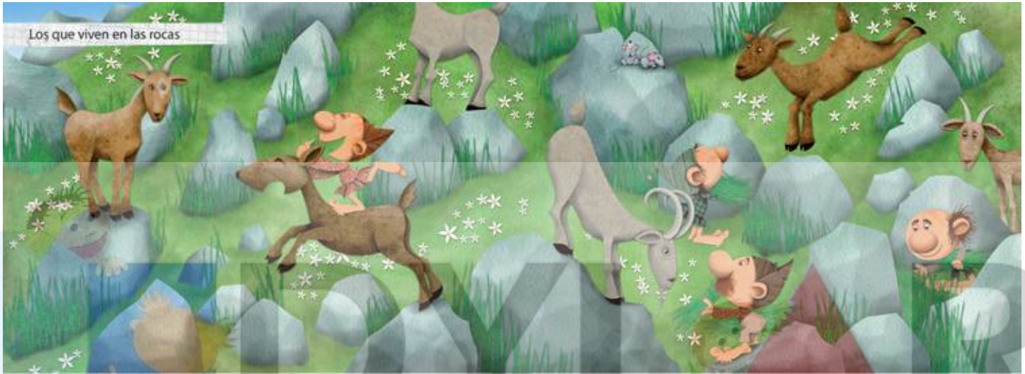
Los que viven en las rocas