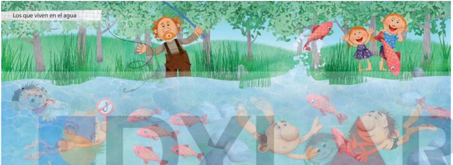
Avisan a los peces cuando vas a pescar...