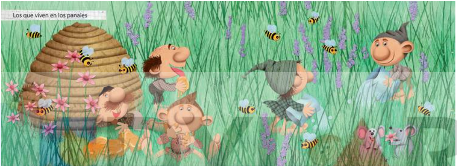
Los que viven en los panales